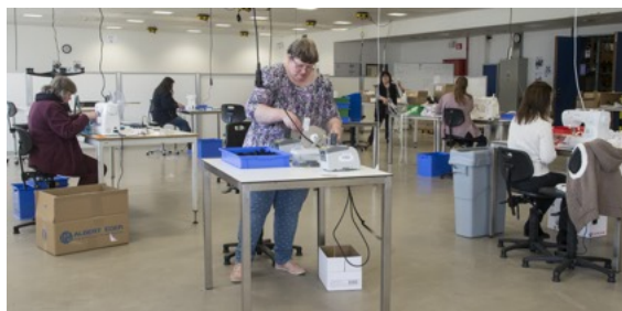
De afstand wordt ook in het atelier gerespecteerd.