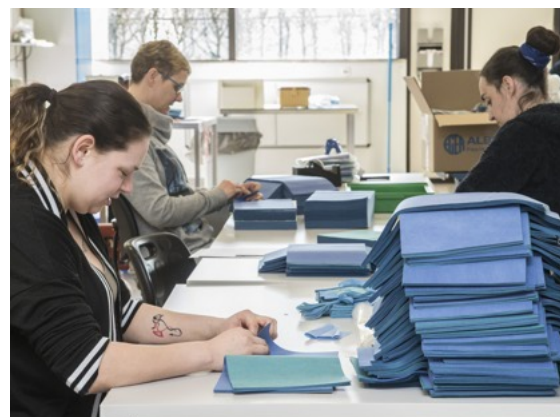
De werknemers tellen de lappen stof voor de pakketten om zelf mondkmaskers te maken.

ten we onze handen in twee gaten steken. Een ingebouwde dispenser sproeit ontsmettende gel op de handen. Pas daarna kunnen we de beugel, die toegang geeft tot de ruimte, opzij duwen.